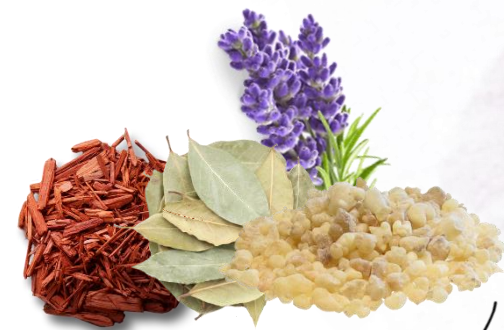
Hierbas, polvos o resinas

El carbón vegetal es un elemento que está preparado para encenderse con fuego (aconsejo con fósforos) y genera calor para quemar los elementos que le pongamos encima. Al comienzo hace un humo blanco que es preciso dejar correr porque tiene químicos.