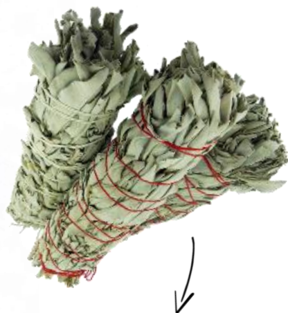
Atados de hierbas

Podes hacerlos o comprarlos. En cualquiera de los casos, te recomiendo muchísimo potenciarlos y consagrarlos para el propósito que quieras. Lo hermoso de estos atados es que podés encenderlos, dejar que se apague y volver a usarlos luego.